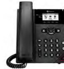
VVX150 art: 43.10.0010

Of het nu gaat om een (thuis)kantoor of een gemeenschappelijke ruimte, u wilt een betrouwbare, betaalbare kleine zakelijke telefoon met een geweldig geluid en uiterlijk - maar u wilt niet te duur uit zijn. Waarom kiezen? Geniet van superheldere gesprekken met een tweeregelige VVX 150-telefoon die betaalbaar en eenvoudig te installeren is en die iedereen kan gebruiken. En laat u betoveren door de Poly Acoustic Fence. Het elimineert achtergrondgeluiden om gesprekken stil te houden, ook al bevindt u zich in een lawaaierige omgeving.